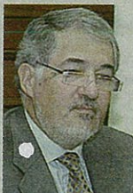
Cándido Conde Pumpido, Fiscal General del Estado

Está claro que se trata de una cuestión de política criminal. Ahora, desde la Fiscalía General del Estado se ha decidido impugnar la lista filtrada por Batasuna Iniciativa Internacionalista-La Solidaridad de los Pueblos, que concurre a las elecciones europeas del próximo 7 de junio. Para Conde-Pumpido, existen indicios de vinculación con la ilegal Batasuna. Pese a todo, es muy conveniente una institución que controla la legalidad impida a los ilegales a que ocupen cargos públicos.