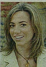
Carme Chacón, ministra de Defensa.

Está claro que se trata de una cuestión de política criminal. Ahora, desde la Fiscalía General del Estado se ha decidido impugnar la lista filtrada por Batasuna Iniciativa Internacionalista-La Solidaridad de los Pueblos, que concurre a las elecciones europeas del próximo 7 de junio. Para Conde-Pumpido, existen indicios de vinculación con la ilegal Batasuna. Pese a todo, es muy conveniente una institución que controla la legalidad impida a los ilegales a que ocupen cargos públicos.